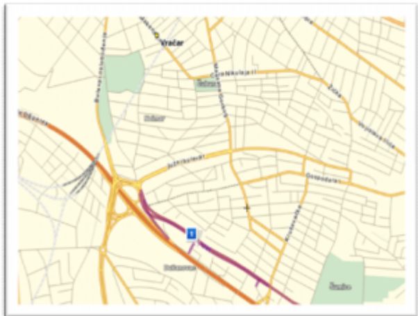
Зграда суда у Устаничкој 14.